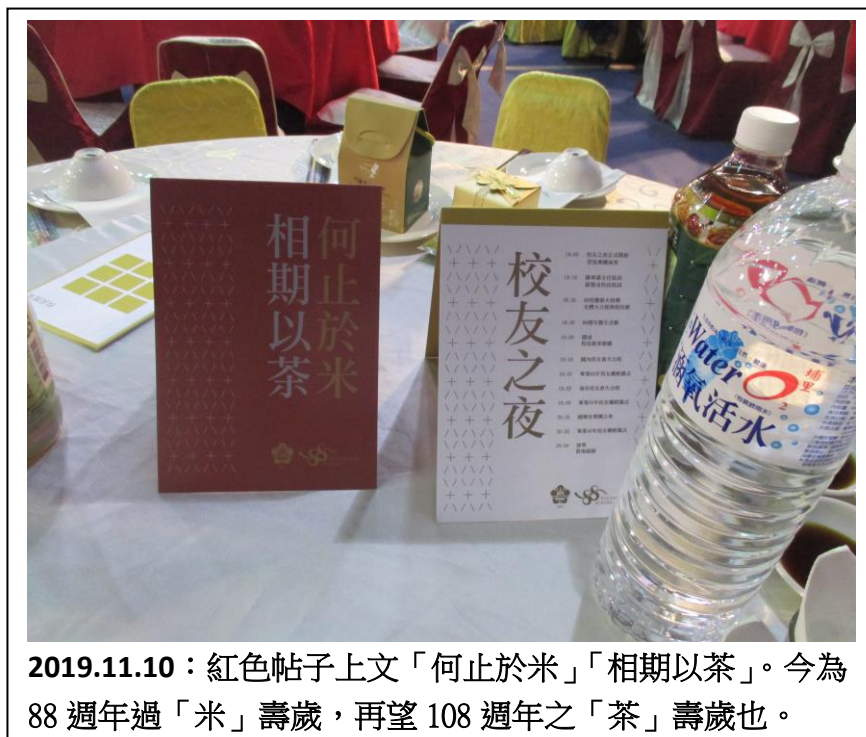
2019.11.10：紅色帖子上文「何止於米」「相期以茶」。今為 88 週年過「米」壽歲，再望 108 週年之「茶」壽歲也。