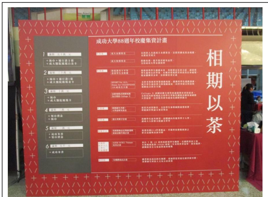
2019.11.10：今為成大 88 周年慶是為「米」壽也

2019 年「校友之夜」是在 11 月 10 日(星期天)於中正堂舉行。化學系友大會經常在星期六舉行，因此化學系友通常可以於參加白天的「系友大會」之後，還趕得上同日或次日晚上的「校友之夜」。