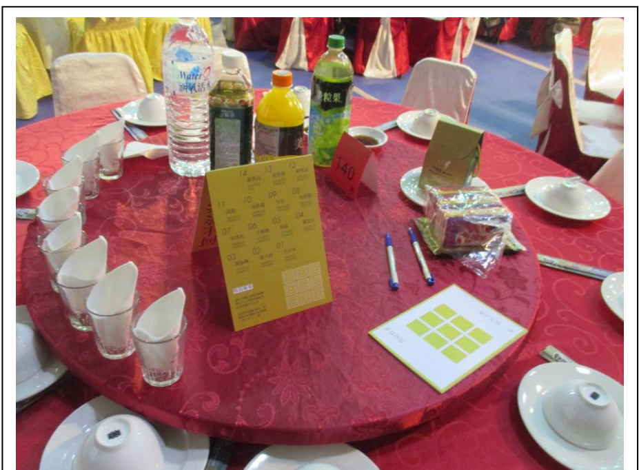
2019.11.10：此為第 140 桌，最後號數之桌。