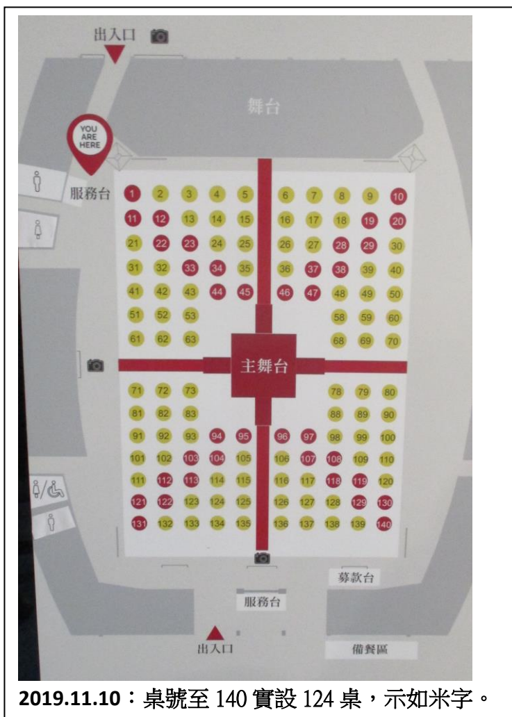
2019.11.10：桌號至 140 實設 124 桌，示如米字。