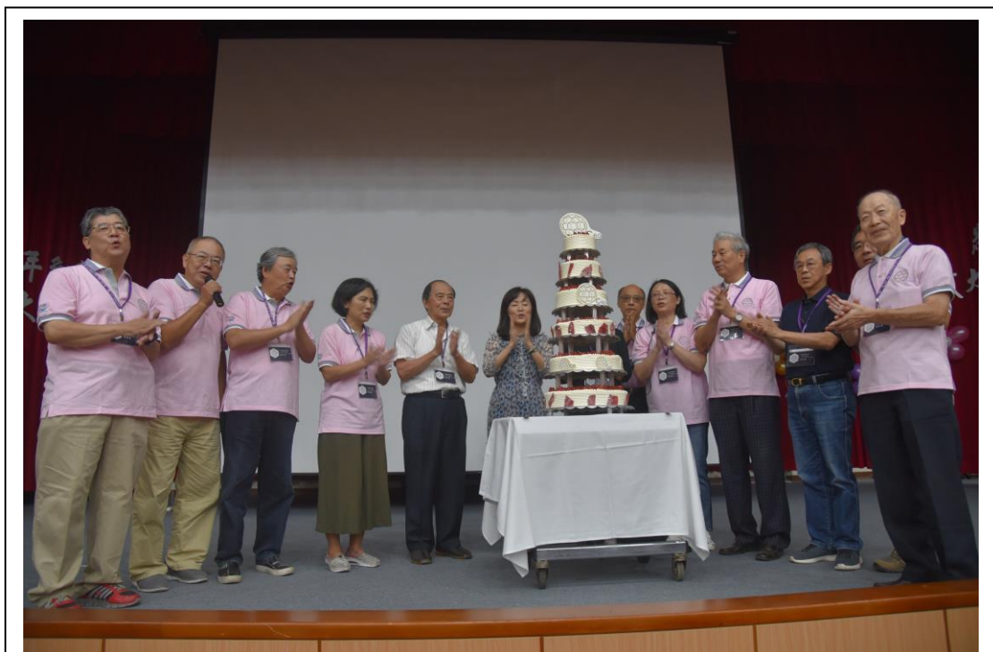
2019.11.9：系友大會 慶賀 60 週年儀式(全場合唱生日快樂歌)