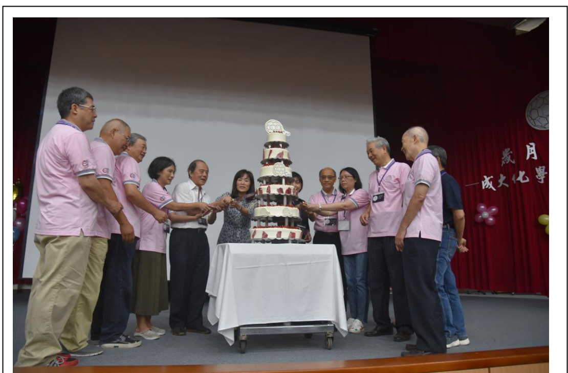
2019.11.9：系友大會 慶賀 60 週年儀式 (校長與系友會委員共切蛋糕)

六層蛋糕是委由遠東香格里拉飯店特別製造，適時推上舞台應景演出，讓全場系友驚喜。蛋糕六層表示化學系成立六十週年，誌喜慶賀。