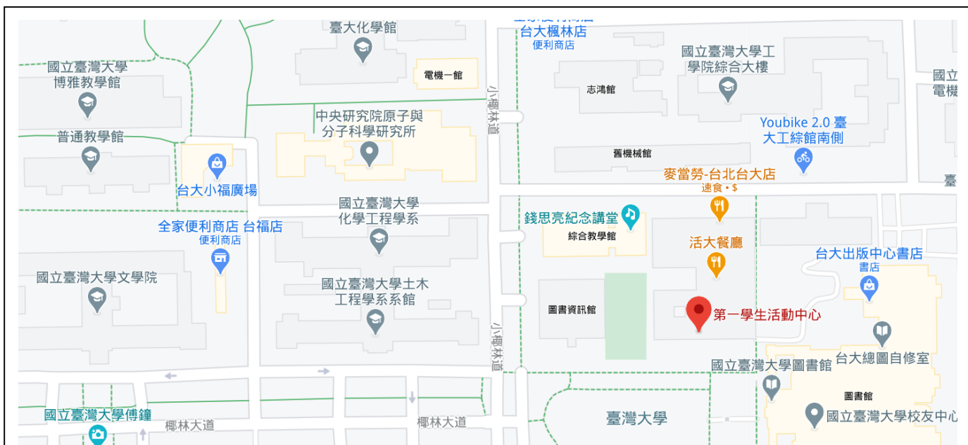
2020.12：台大校園(部分地圖)，顯示學生活動中心與小福廣場之相對位置。