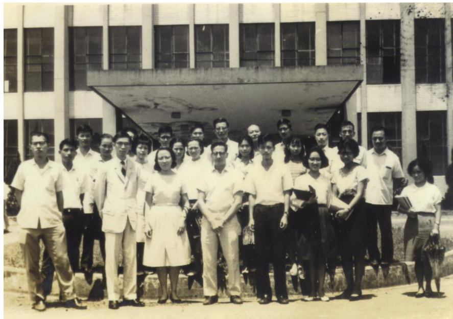
1966.7.1~8.25：暑期科學研討會化學組合照於台大化學館前