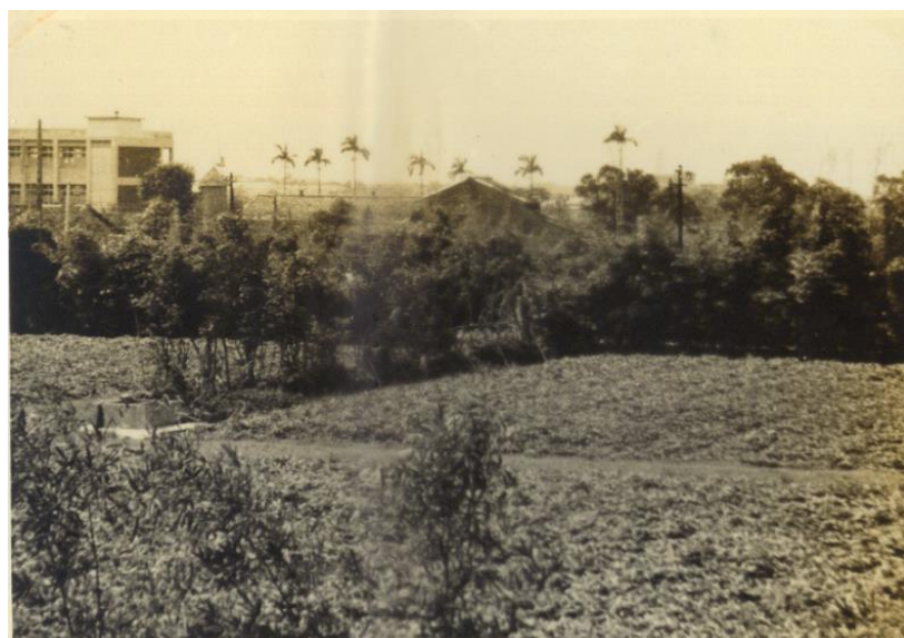
1966.7.1~8.25：暑期科學研討會；由台大男生第八宿舍向 西眺望台大農場。