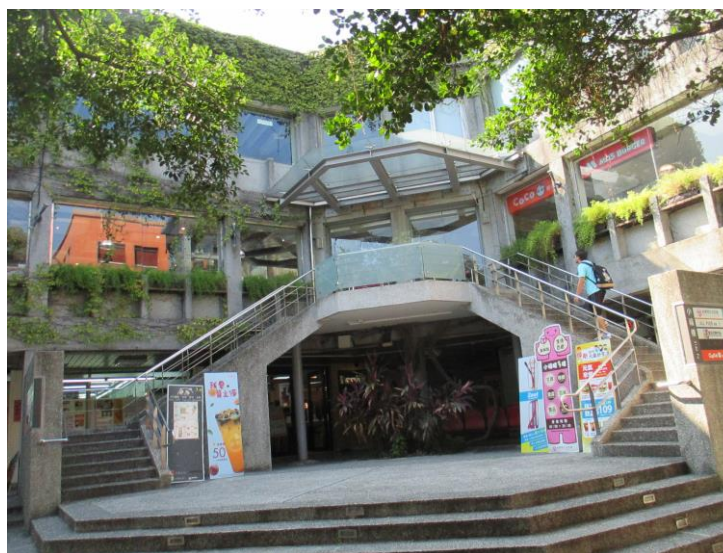
2019.10.5：今日台大之「小福廣場」，建築物仍然是原來的，與 1966 年看到的相同。

學生活動中心斜對面的「小福廣場」，其中的「福利社」供應百貨，各種冷飲以及台大農場生產之牛奶，皆是客人鍾愛之物品。一樓設立之郵局，提供郵寄以及電話，是那 1960~1990 年代電話尚未普及時之獨占事業經營，一般人跟親友聯絡皆以書信為之，若趕時間就打公用電話（那年頭一般人家沒有電話，成大化學系只有二支電話，一在主任室一在辦公室）。