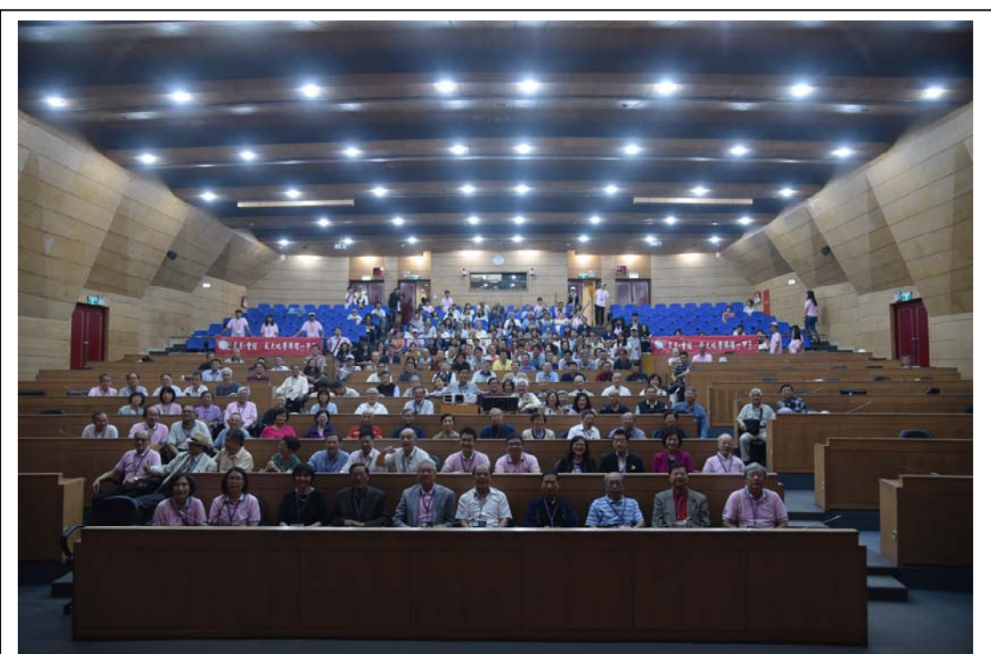
2019.11.9：系友大會 大會禮成 合照於大會場