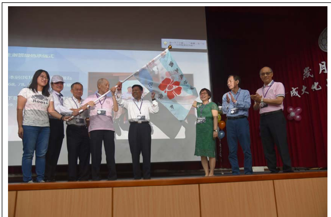
2019.11.9：系友大會 主辦之爐主班交接 今(2019/108)年之 68,78,88,98 級交給 69,79,89,99 級