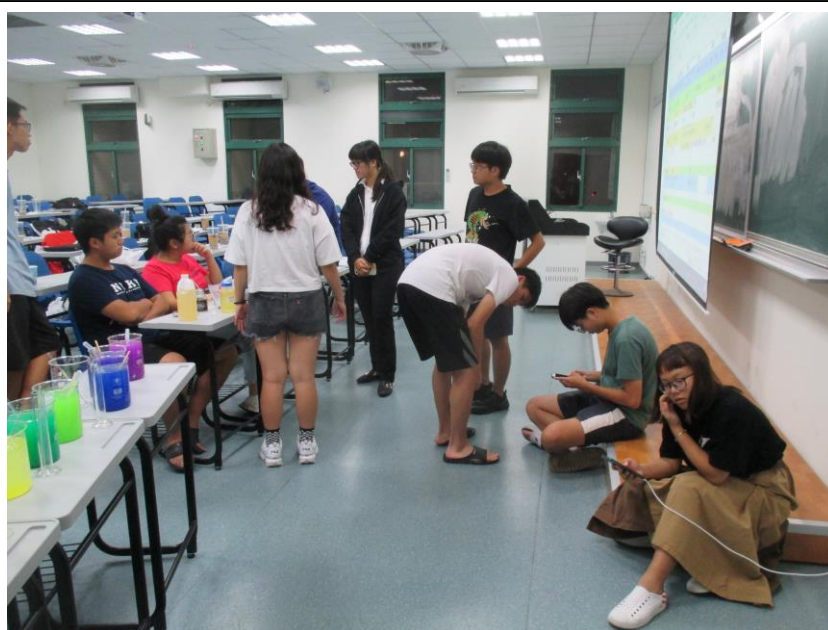
2020.11.6：下午 9：26 化學新館之布置工作仍在進行中