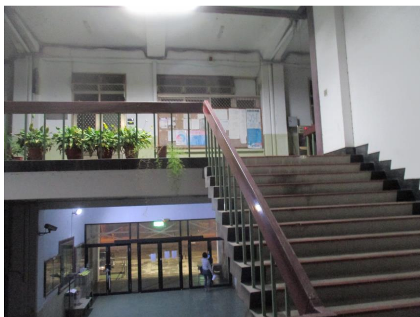
2020.11.6 ：下午 5：40 天黑了的舊系館樓梯燈光明亮