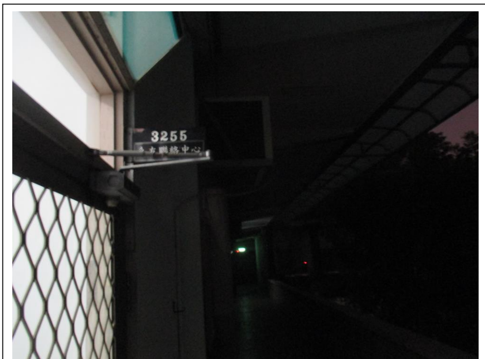
2020.11.6：下午 5：38 天就黑了，系友聯絡中心燈火通明趕工作。

晚上七點鐘在化學系會議室，召集學生系會人員，講解大會過程與工作項目，分配人手。然後大伙就趕緊去布置會場以及報到台，張貼指示牌、桌位圖及座位表.....，務須一切準備妥當，讓明天的系友大會活動順利進行。