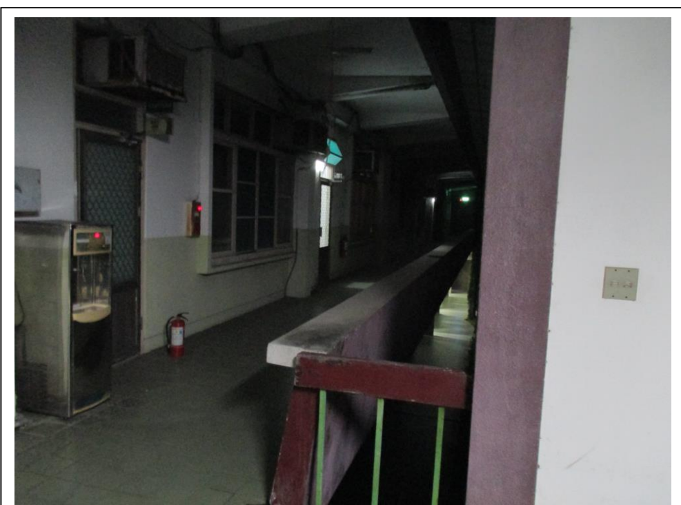
2020.11.6：下午 5：38 天黑了,系友聯絡中心以及樓梯仍然燈火明亮.