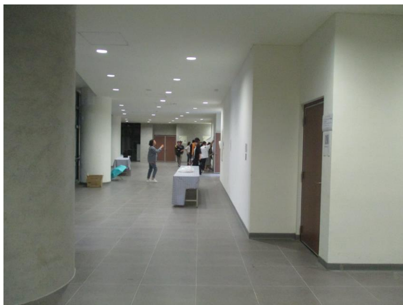
2020.11.6：下午 9：03 化學新館之布置工作仍在進行中

整個化學新館的一樓走廊至大廳，明亮燈光下，有一群化學人正在忙著布置明天的系友大會場地。畢業生學長姐帶領在校生學弟妹，一同工作，此情此景真的是化學系大家庭啊！尤其是這次的在校生多是二年級生以及一年級生，好可愛的年輕力壯小伙伴們啊！此次的系友大會活動過程，必可讓這群工作人員留下美好回憶。