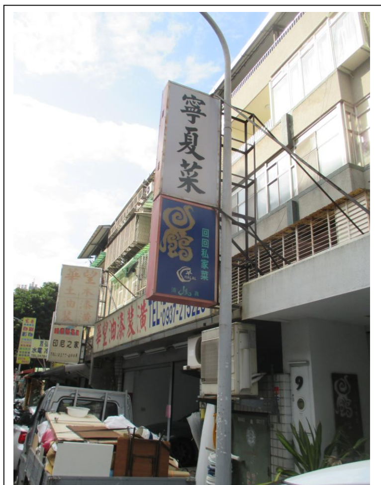
2020.1.16：寧夏菜小館(八德路三段 12 巷 51 弄 9 號)