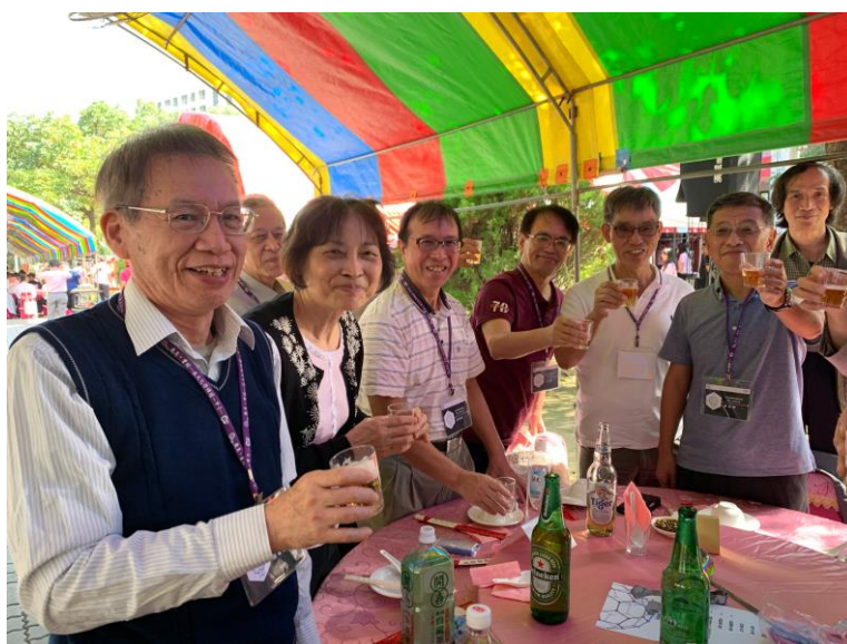
2019.11.9：另桌 62 級同學合照