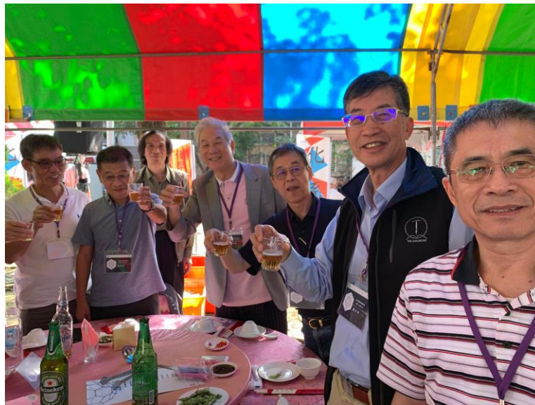
2019.11.9：這桌 62 級同學合照