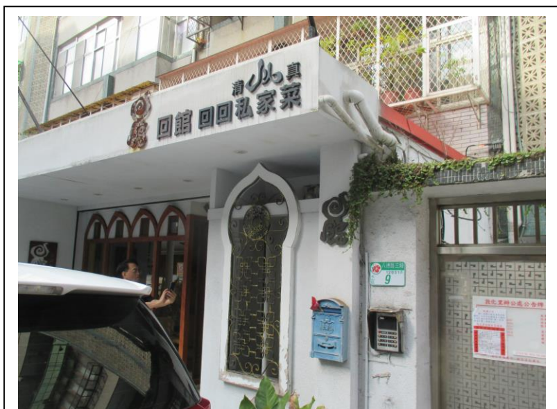
2020.1.16：寧夏菜小館(清真 回館 回回私家菜)