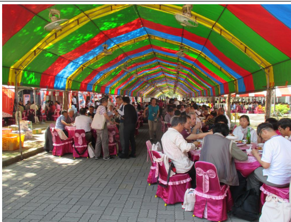
2019.11.9：前面這二桌(左,36 桌、右 63 桌)就是 62/1973 級系友之桌