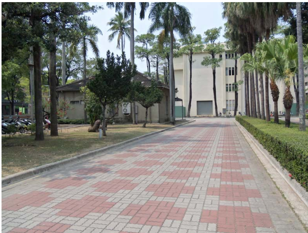
左方椰林圍住的小屋是「阿婆文具部」的早期駐點所在 (2012.3.28 攝)