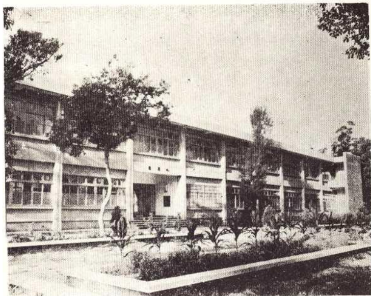
↑ 巍峨的化學系系館