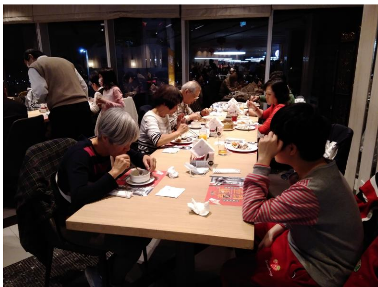
2021.1.21：化學系歲末聯歡餐會在「南紡夢時代漢來海港餐廳」（台南市東區中華東路一段 366 號四樓）