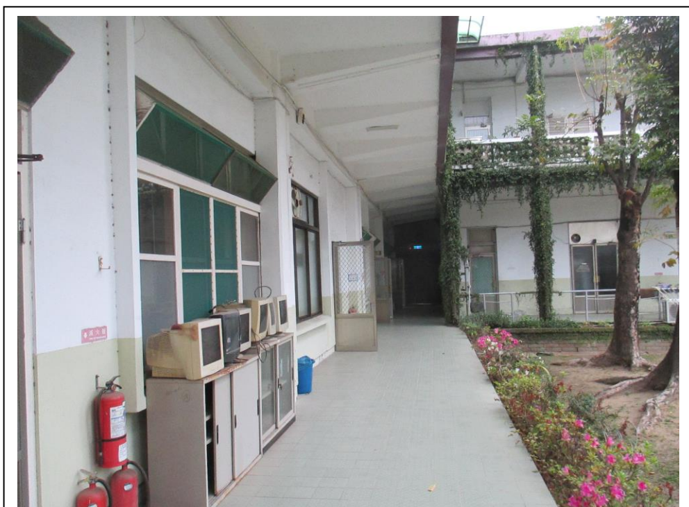
109(2020).3.24 : 舊系館樓下西邊的有機化學實驗室 (系館邊門關閉)