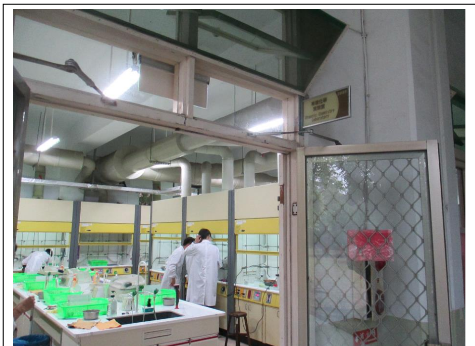
109(2020).3.24 : 舊系館樓下西邊的有機化學實驗室在使用中